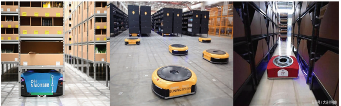
图5 电商平台自主研发的AGV

当前,越来越多的企业在物流管理、制造装配上均大幅增加了以机器替换人的岗位。类如近年来的“双十一”、“6.18”等购物狂欢节当下,巨量的实物数据需要可观的人力成本投入,而智慧物流当中尤其以AGV技术为核心驱动力量,阿里巴巴、苏宁易购、京东等电商平台公司,也相继推出自主研发的能够应对海量数据管理与运输货物的AGV(见图5)。因此,研发AGV的新技术已刻不容缓。随着世界人口逐渐趋于老龄化,人力成本的急剧上升,发展智能制造,智慧物流已是必然的发展趋势。发展AGV技术即是发展民族工业,发展AGV产业即是建造人类智能时代的新格局,相信在未来人类科技不断创新的引领下,智能制造最终会为人们提供更为先进的生产方式和更为便捷的生活环境。