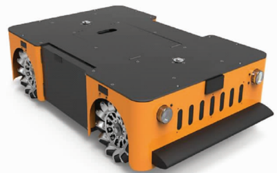
图 2 全方位移动 AGV