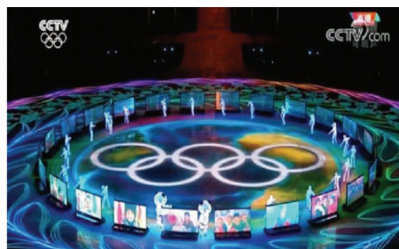
图3 新松AGV在平昌冬奥会

2019年1月3日,“玉兔二号”,嫦娥四号任务月球车(见图4),于22时22分完成与嫦娥四号着陆器的分离,驶抵月球表面,再次实现月球表面着陆,成为中国航天道路上又一个里程碑式的技术突破。目前市场上,中国已是全世界AGV需求最大的发展中国家,而AGV也将是制造业进入快速时代的必须配套设备,随着国家对科技强国战略的投入力度的不断加大,未来中国的AGV一定会拥有更为广阔的市场前景。