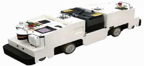
图 1 差速轮式移动 AGV

(4) 按照运动工作过程中自由度的性质, 大致分为两大类: 差速轮式 AGV (见图 1) 与全方位移动 (麦克纳姆轮式) AGV (见图 2)。国内市场多采用差速轮 AGV。